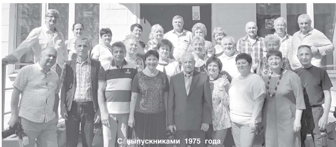
С выпускниками 1975 года