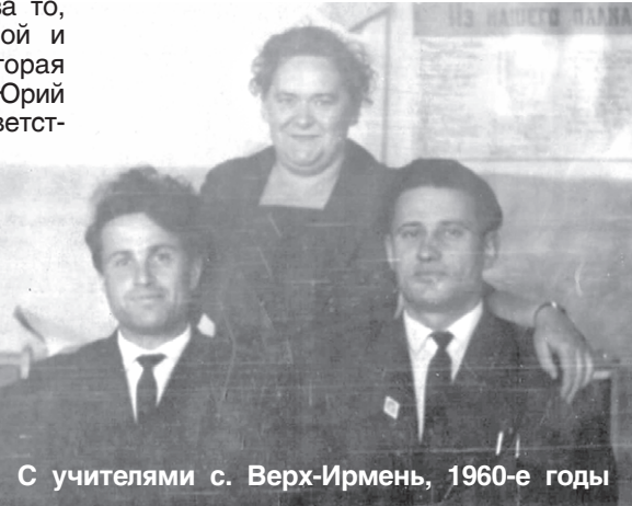
С учителями с. Верх-Ирмень, 1960-е годы

честв руководителя - быть в курсе всех дел, контролировать всё происходящее в школе, при этом не подавляя, не лишая свободы действий. Знание, что тебе не позволят «выйти из берегов», на мой взгляд, давало свободу творить, вселяло уверенность и обеспечивало спокойствие и надежность. Когда мы были учениками, твердо знали, что от всевидящего ока директо-