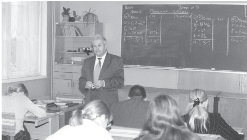
С выпускниками 1975 года