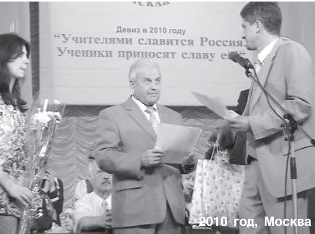
2010 год, Москва