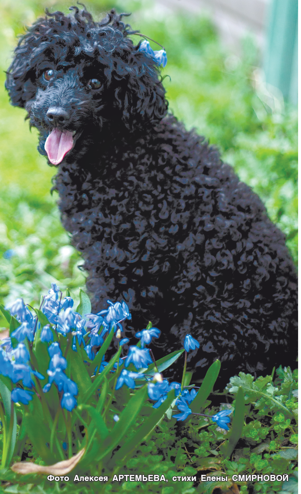
стихи Елены СМИРНОВОЙ

Апрель - раздолье первоцветов, Душистых трав и солнца света. И предвкушает радость лета Собака - радость человека.