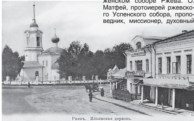
Ржев. Ильинская церковь.

Интересная деталь. Официальное название церкви - во имя Рождества Богороди-