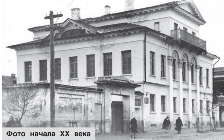
Фото начала XX века

ных граждан XIX и начала XX веков было немало представителей рода Немиловых, поскольку в то время нисходящим членам семьи предоставлялось потомственное почетное гражданство. Одним из последних в этих списках стал Александр Климович, купец первой гильдии, родившийся в 1848 году в Ржеве и похороненный в 1920 году в Петрограде на Громовском старообрядческом кладбище. В Ржеве сохранился семейный некрополь купеческого рода Немиловых. На центральной аллее старообрядчес-