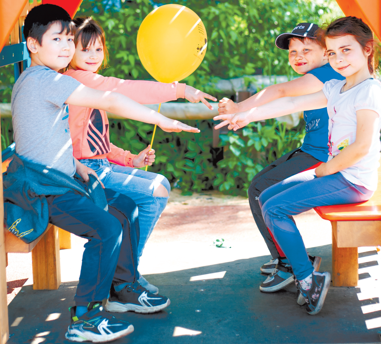
Фото Алексея АРТЕМЬЕВА, стихи Елены СМИРНОВОЙ

Праздник детства не случайно В самый первый летний день: Ребятишек поздравляют И цветущая сирень, И полёт над Волгой чаек, И ромашки на меже. Любим, ценим, защищаем Наше будущее, Ржев!