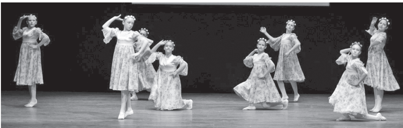
Фото участников конкурса

- Мне понравилось то, что мы были вместе, друг другу помогали. Очень старались хорошо выступить. И у нас всё получилось!