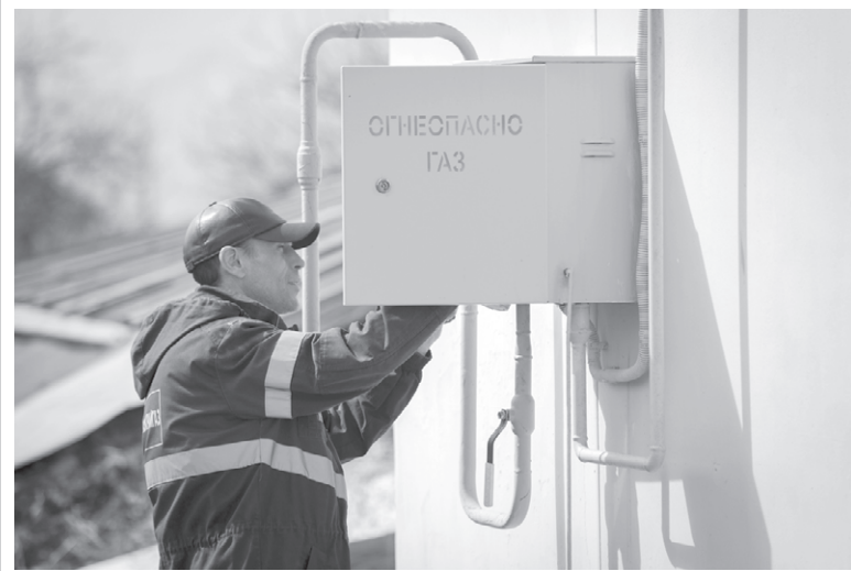
Страницу подготовила Светлана КУДРЯВЦЕВА

Это, несомненно, будет способствовать развитию экономики округа и повышению уровня жизни населения. Кроме того, газификация деревень может способствовать развитию малого и среднего бизнеса в сельских поселениях, так как это создаст новые возможности для предпринимательства и привлечения инвестиций. В целом, газификация деревень является важным шагом на пути к развитию сельской местности и улучшению качества жизни людей, проживающих в ней.