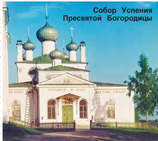
Собор Успения Пресвятой Богородицы