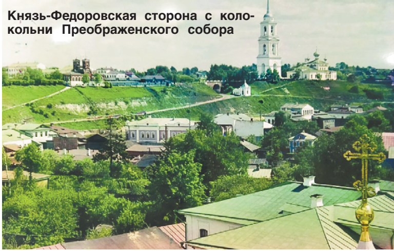
Князь-Федоровская сторона с колокольни Преображенского собора

Выставку открывает экспозиция, посвящённая Ржеву до революционному. На карте города 1908 года с прежними названиями улиц крестиками отмечены существующие в то время храмы - их было более двадцати. Есть предание, что во время звона колоколов ржевских церквей звук был слышен даже в Старице. Можно полюбоваться фотографиями Екатерининской церкви с находящейся неподалёку мужской гимназией (сейчас там Дворец культуры), прежним видом здания Мазуринского приюта. А также храмами и архитектурными объектами, которых город лишился во время военной разрухи.