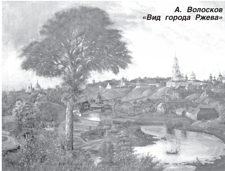
А. Волосков «Вид города Ржева»

В полотне художник охватил как можно больше красивых строений города, сблизил их. Композицию картины держат две вертикали: высокое дерево с рельефной кроной, в тени которого и должен был устраиваться за мольбертом художник, как это было принято в сюжетах картин XIX века. Вторая вертикаль вдали - колокольня Успенского собора с её высоким шпилем.