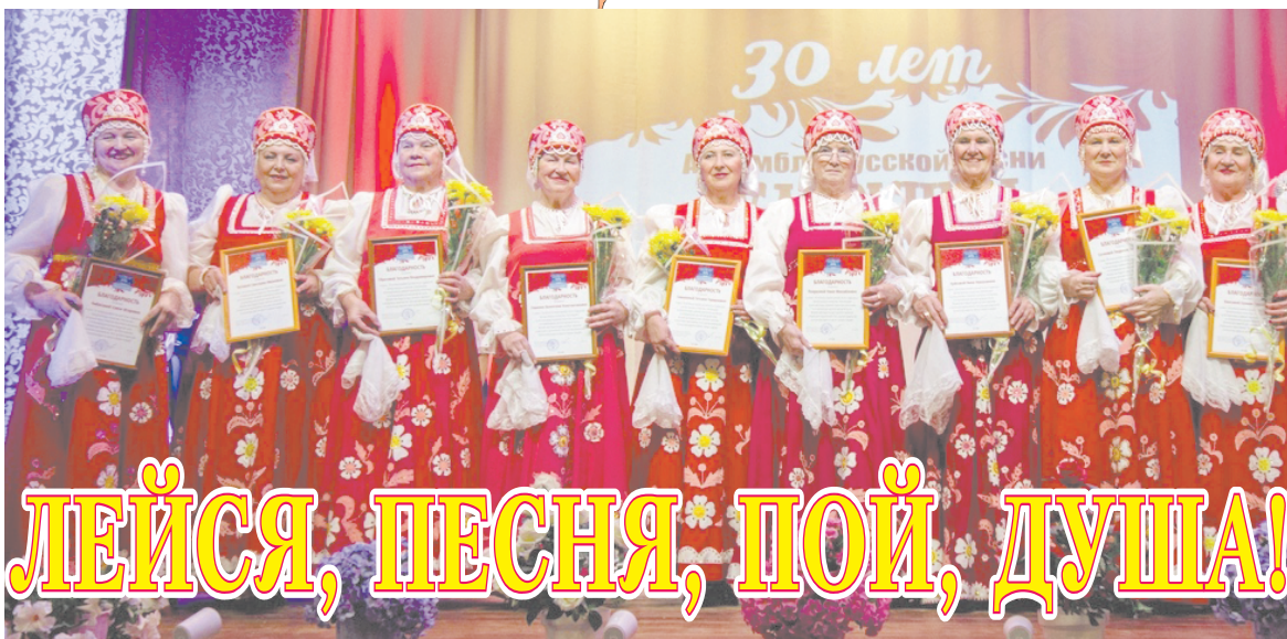
18 ноября ансамбль русской песни «Сударушка» отметил свое 30-летие большим красочным концертом «Лейся, песня, пой, душа!», который наверняка надолго запомнят все его зрители.

Свою славную историю он начал в 1952 году как пионерский лагерь имени Семашко. В 1984-м был открыт новый двухэтажный жилой корпус со всеми удобствами. Введено в эксплуатацию комплексное здание столовой и спортивный зал, и целый ряд других сооружений. Свежими продуктами питания - молоком, мясом, овощами - лагерь обеспечивало подсобное хозяйство комбината, расположенное неподалеку. В «Зарнице» отдыхали дети не только из Ржева и Тверской области, но и других регионов и даже стран, например, из Германии. В годы рыночных реформ лагерь, как и большинство предприятий и объектов города, пришёл в упадок. А в 2003 году перешёл в собственность администрации