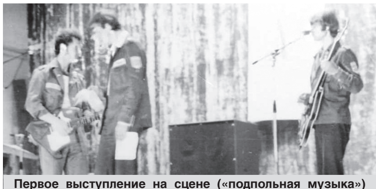
Первое выступление на сцене («подпольная музыка»)

Елена СООЛЯТТЭ