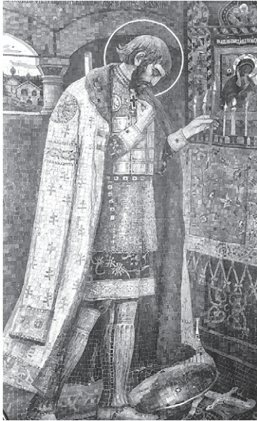
Окончание. Начало в № 12