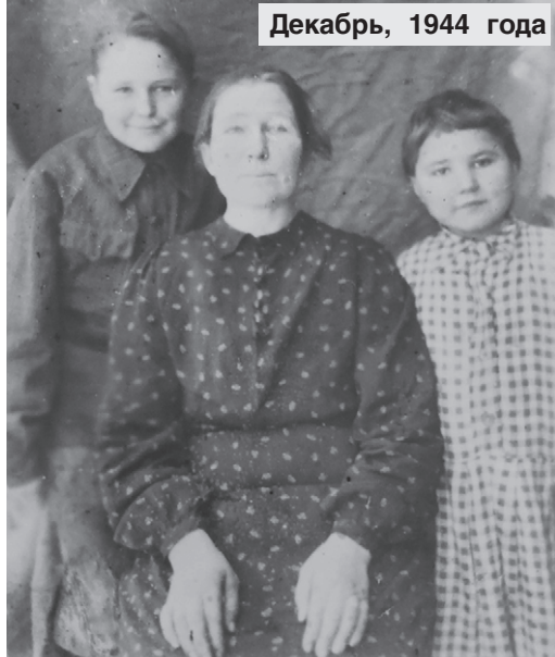
Декабрь, 1944 года