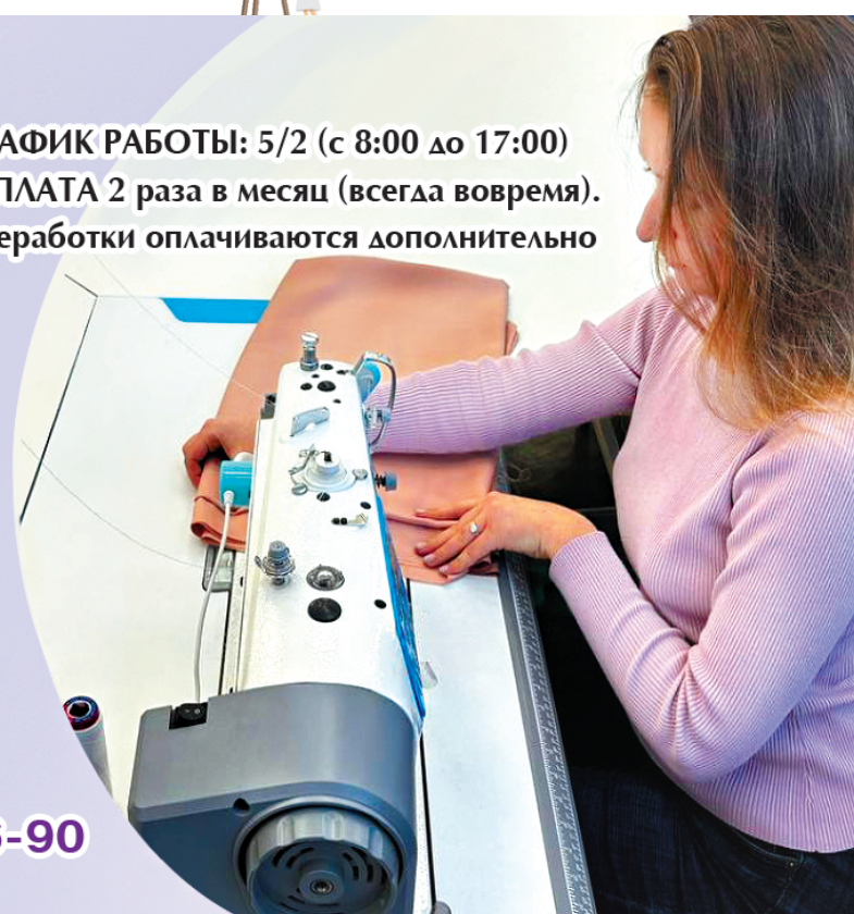
ГРАФИК РАБОТЫ: 5/2 (с 8:00 до 17:00) ЗАРПЛАТА 2 раза в месяц (всегда вовремя). Переработки оплачиваются дополнительно