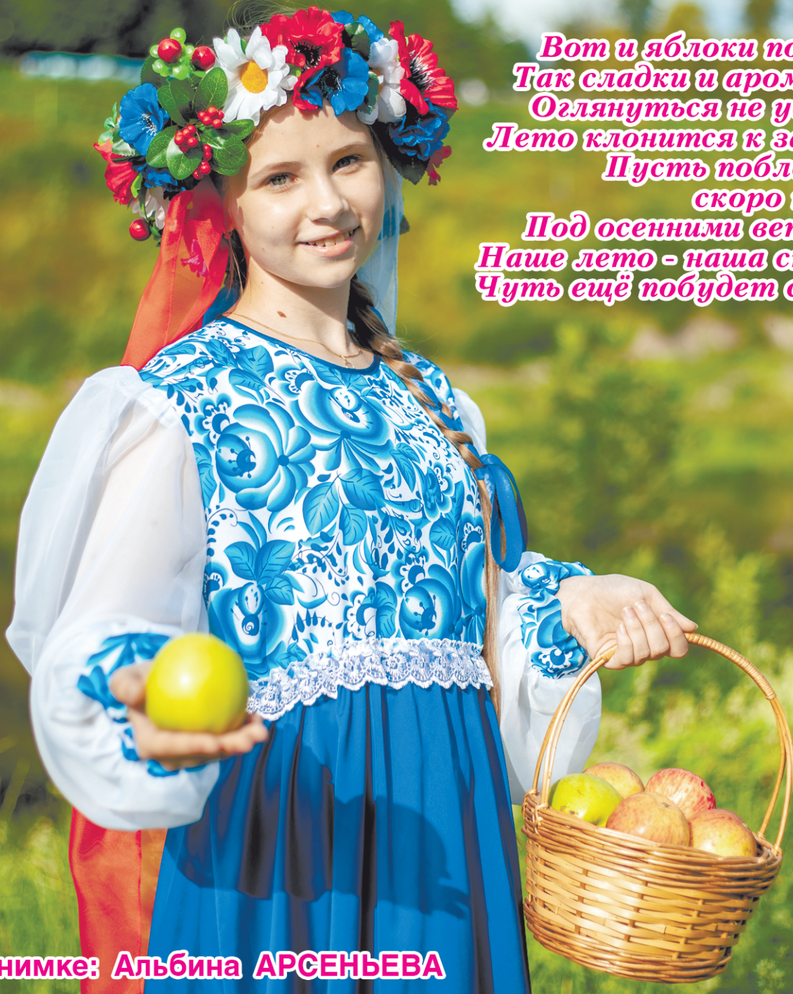
Фото Алексея АРТЕМЬЕВА, стихи Елены СМИРНОВОЙ

Вот и яблоки поспели, Так сладки и ароматны! Оглянуться не успели - Лето клонится к закату. Пусть поблекнут скоро краски Под осенними ветрами, Наше лето - наша сказка - Чуть ещё побудет с нами!