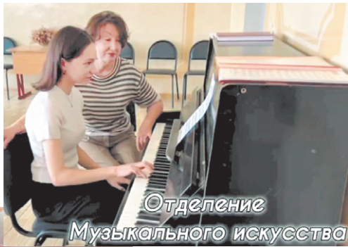
Отделение Музыкального искусства